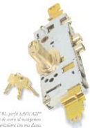
Cilindro AZ 01, perfil A2P/A2P* protegido por una funda de acero al manganeso. Se suministra con tres llaves.